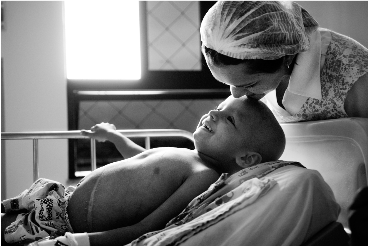
Enfermeira acaricia a careca recente de menina que passou por quimioterapia. Fortaleza, CE.