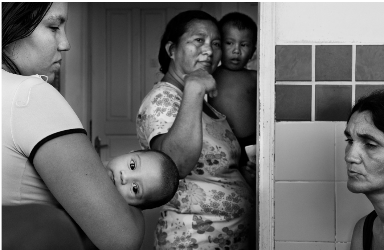
Fila em posto de saúde para atendimento pela equipe transportada em barco-hospital no Amazonas. Vila do Jacaré, Manacapuru, AM.