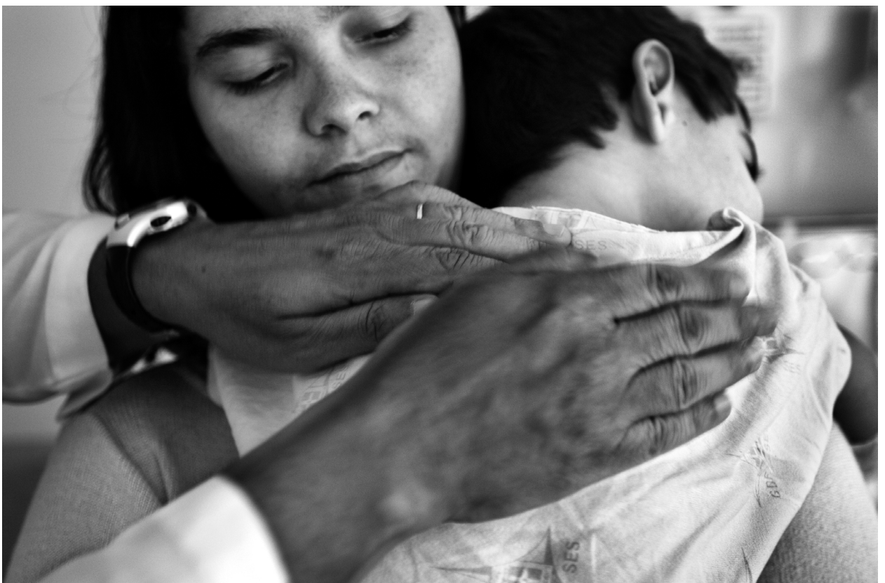
Mãe acolhe o filho enquanto o médico o examina e dá conselhos sobre massagem para diminuir a tosse do garoto. Brasília, DF.