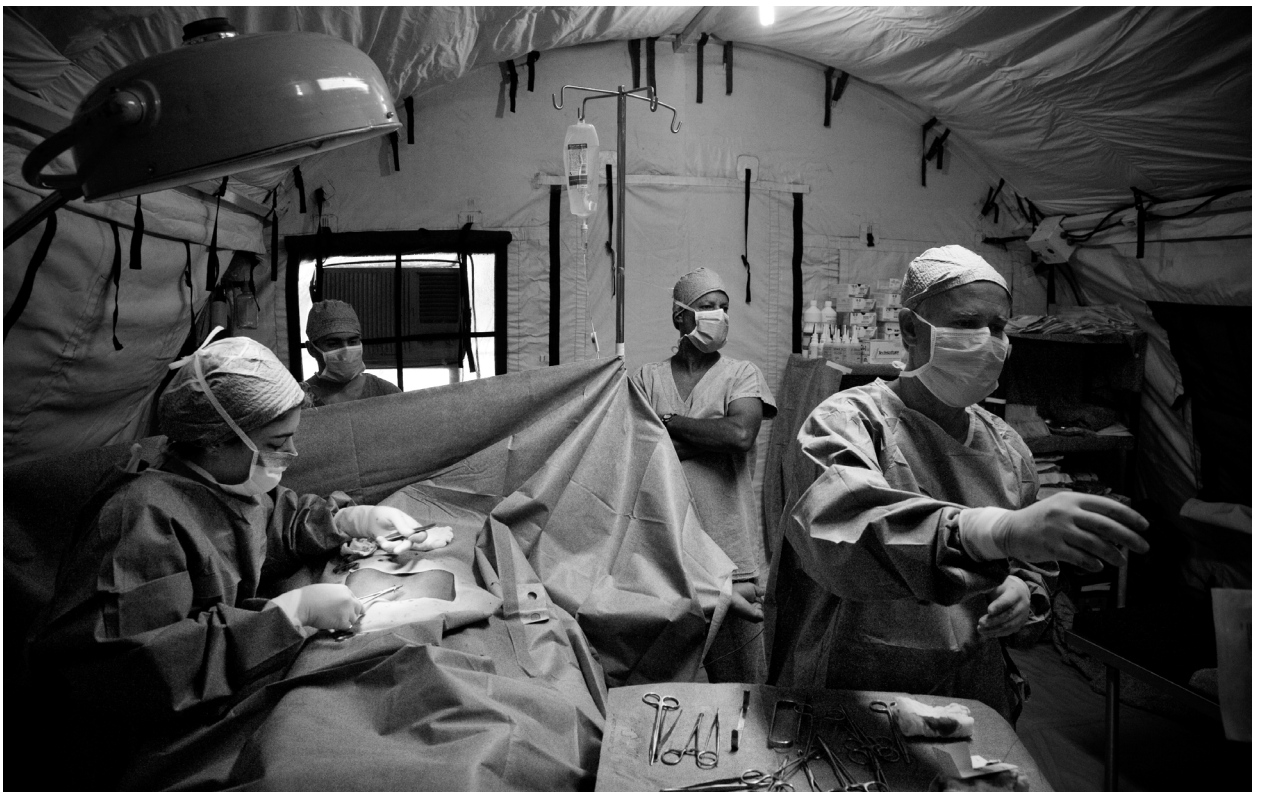
Cirurgia realizada dentro do centro cirúrgico montado na comunidade de Vila Nova pelos Expedicionários da Saúde, grupo de voluntários que atende comunidades isoladas do país, realizando atendimento e procedimentos cirúrgicos simples para resolver problemas como catarata e hérnia. Comunidade de Vila Nova, AM.