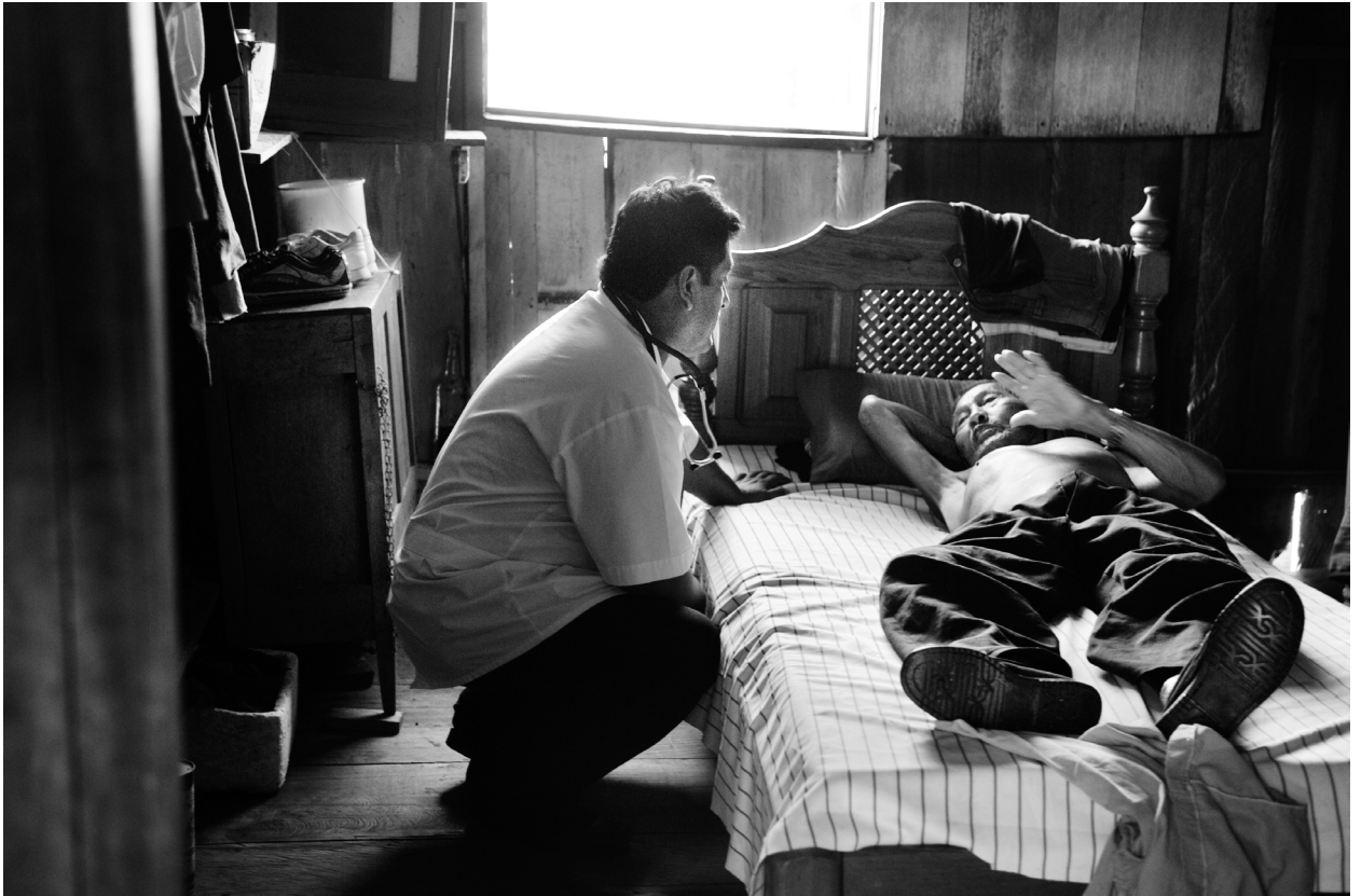
Equipe de médicos viaja de barco para atender pacientes que moram em locais de difícil acesso ao posto de saúde. Coari, AM.