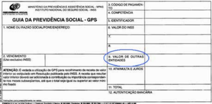
Modelo de Guia GPS