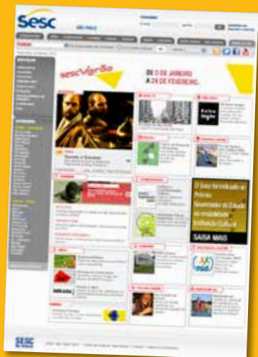
Portal SESC seccsp.org.br